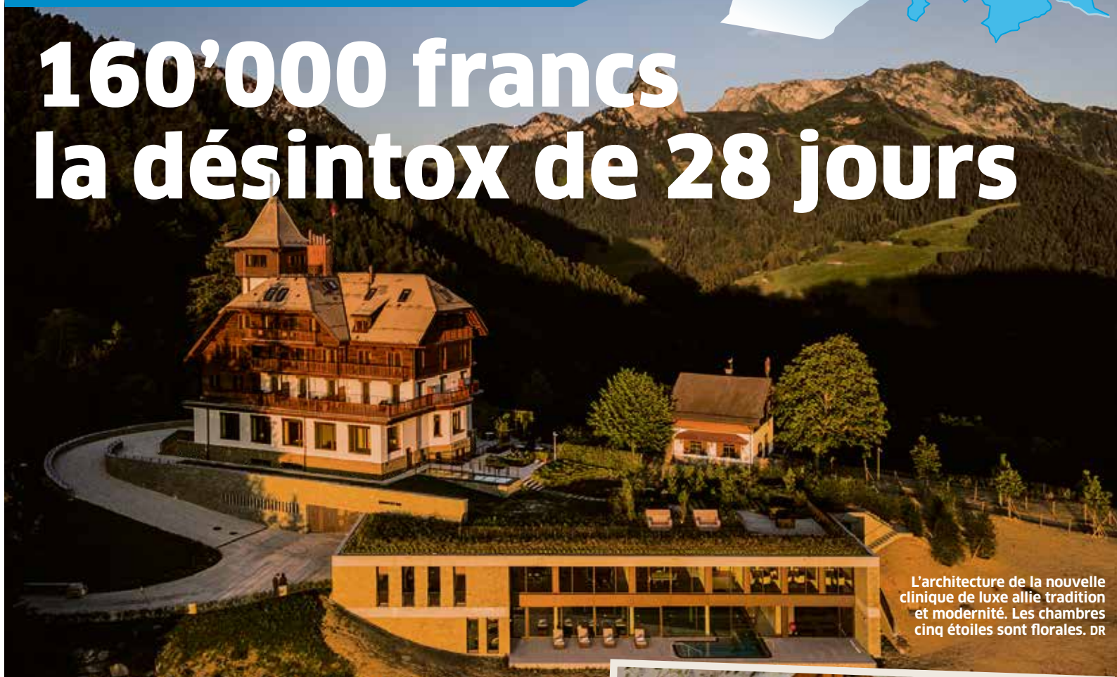
L'architecture de la nouvelle clinique de luxe allie tradition et modernité. Les chambres cinq étoiles sont florales. DR